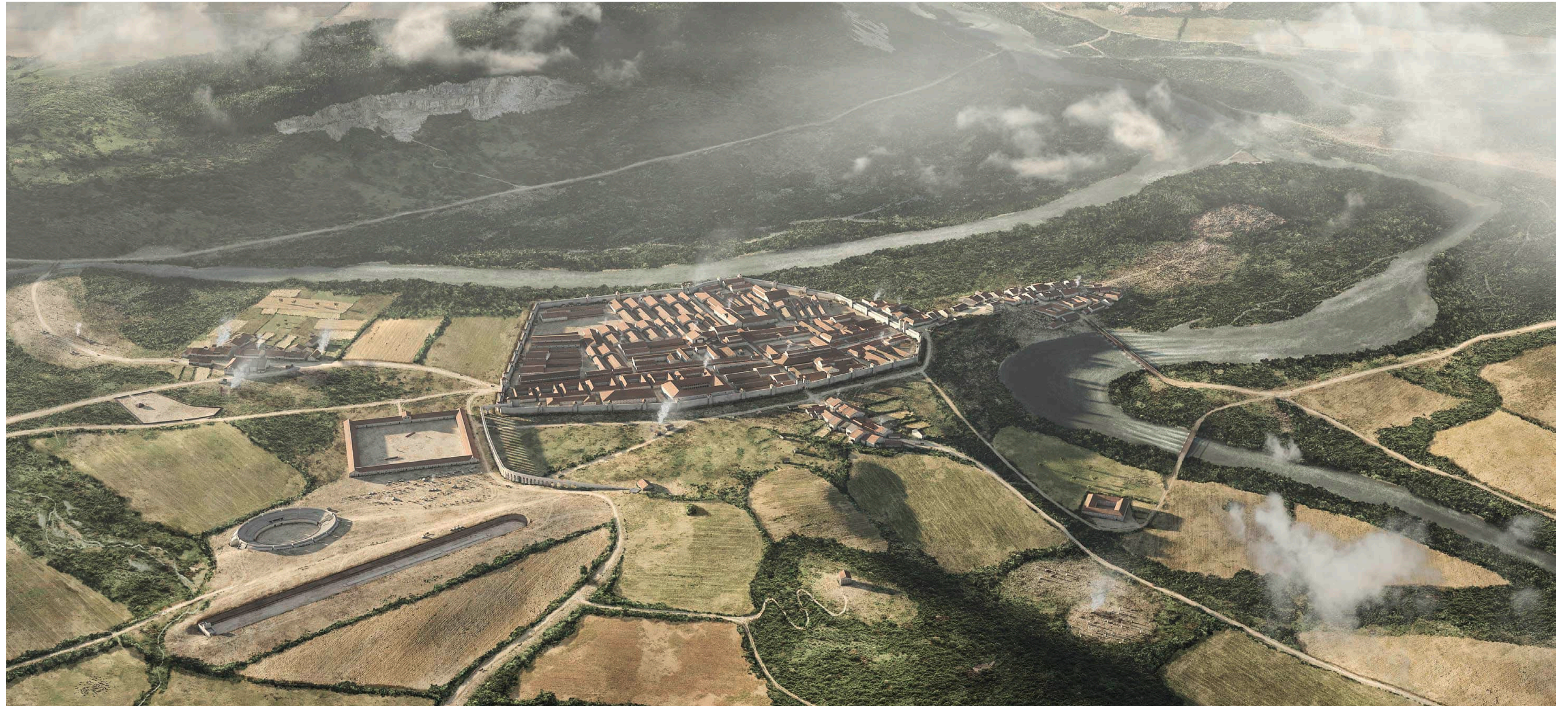
Beilage 2: Ein «Lebensbild» des römischen Vindonissa mit Legionslager und Zivilsiedlung im späten 1. Jahrhundert n. Chr., Blick von Süden, Forschungsstand 2021 (Kantonsarchäologie Aargau/ikonaut GmbH, Brugg).