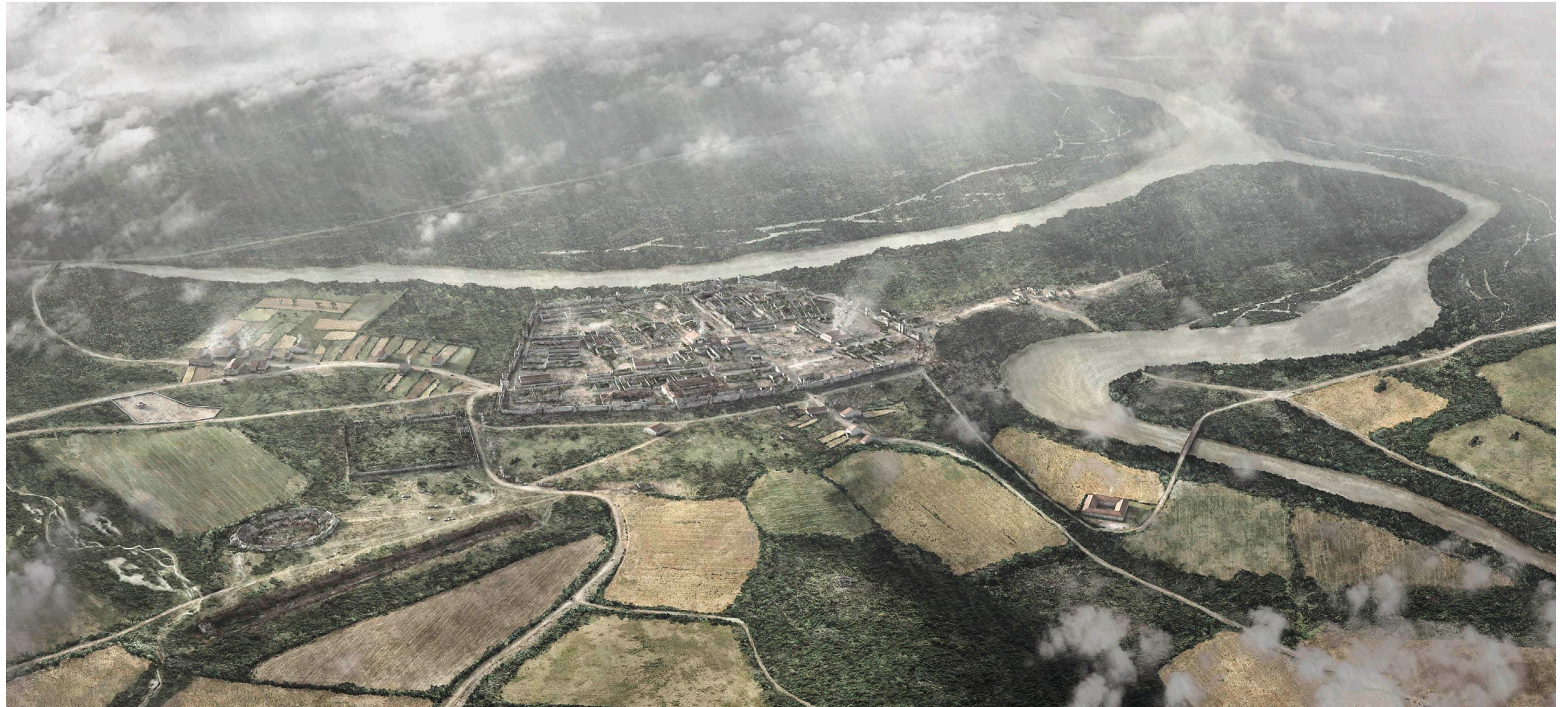
Beilage 3: Ein «Lebensbild» des römischen Vindonissa im frühen 3. Jahrhundert n. Chr., Blick von Süden, Forschungsstand 2021 (Kantonsarchäologie Aargau/ikonaut GmbH, Brugg).