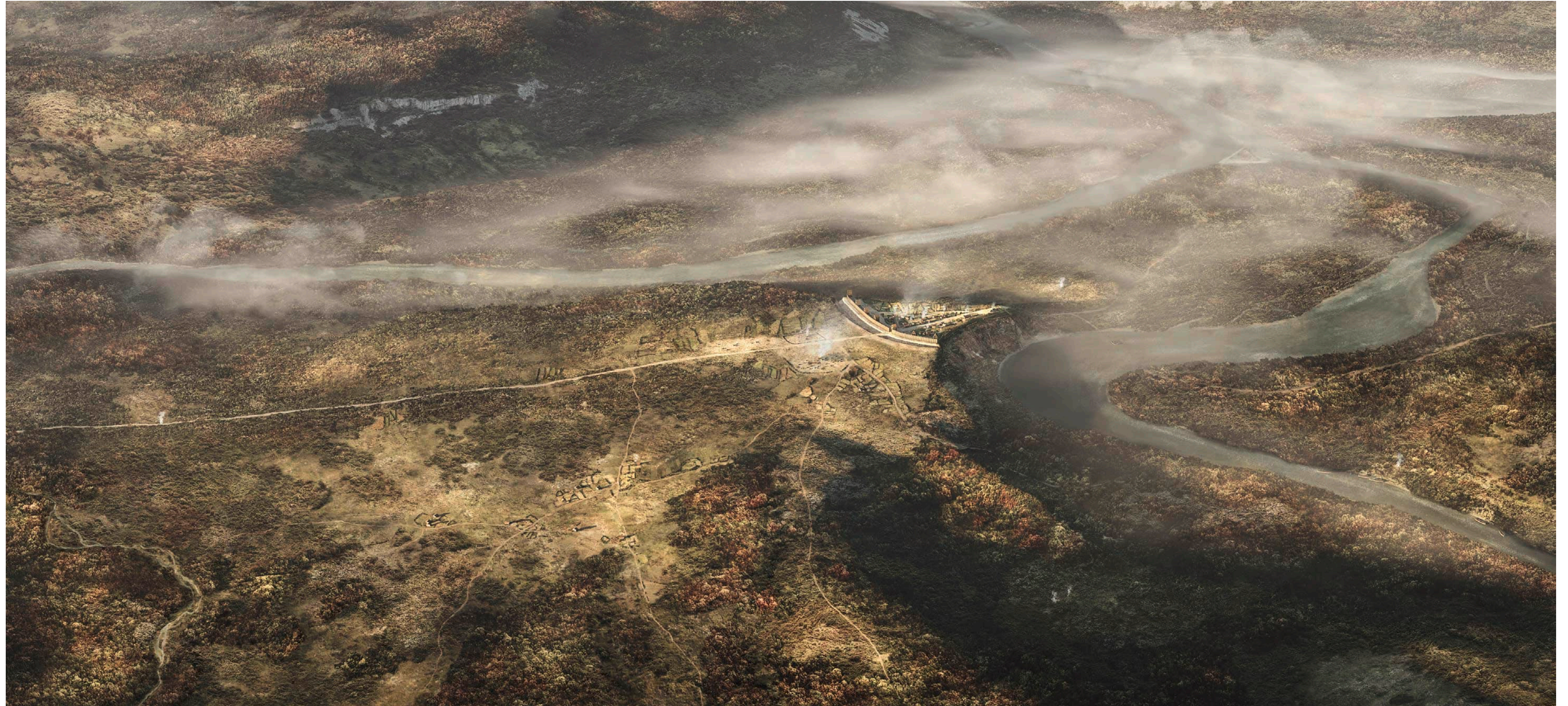
Beilage 1: Ein «Lebensbild» des keltischen Vindonissa im 1. Jahrhundert v. Chr., Blick von Süden, Forschungsstand 2021 (Kantonsarchäologie Aargau/ikonaut GmbH, Brugg).