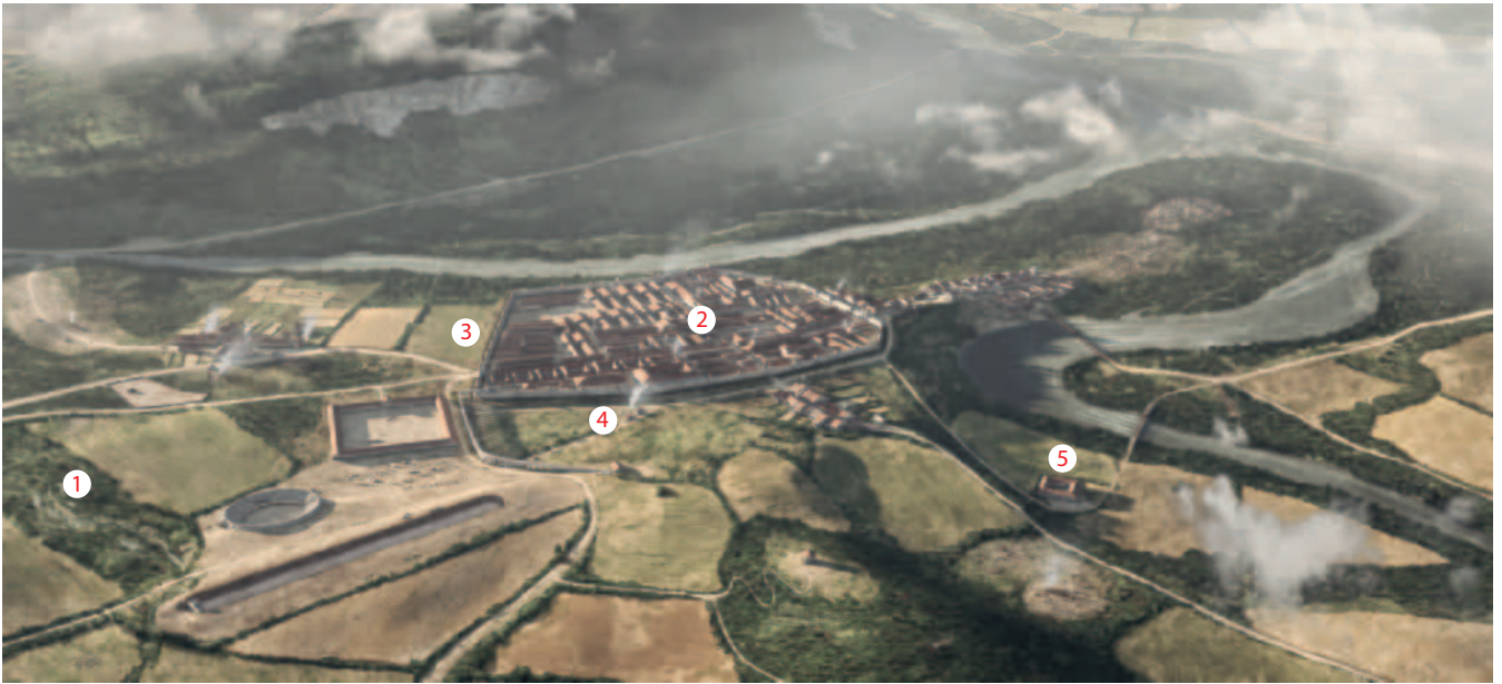
Abb. 2: Lebensbild zum legionslagerzeitlichen Vindonissa. Verkleinerte Darstellung der Beilage 2 mit Lokalisierung der im Text erwähnten Bereiche.

datieren bereits in den spätestkeltisch-frühhömischen Kontext der «Vorlagerzeit» und wurden deshalb bei der Rekonstruktion der vorliegenden Siedlungslandschaft nicht berücksichtigt 13 . Hingegen deuten weitere, mittels 14 C-Analyse erzielte spätlatènezeitliche Datierungen von Skelettfunden aus dem Bereich eines späteren Sakralbezirktes des 1. und 2. Jh. an, dass auch hier mit einem vorrömischen Sakral- und Funerärareal zu rechnen ist (V.014.4, V.018.1) 14 . Für das vorliegende Lebensbild wurde dies in Form eines kleinen, unbefestigten Siedlungsareals südwestlich ausserhalb des Plateaus umgesetzt.