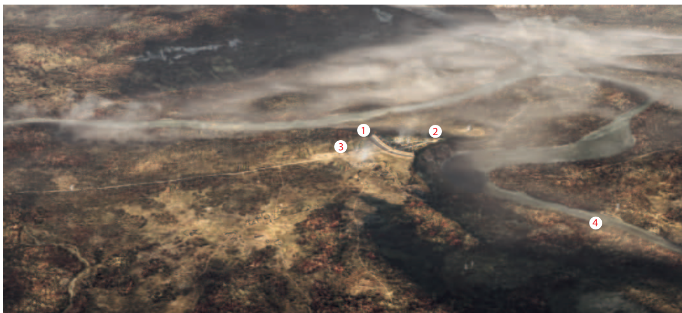
Abb. 1: Lebensbild zum spätkeltischen Vindonissa. Verkleinerte Darstellung der Beilage 1 mit Lokalisierung der im Text erwähnten Bereiche.

und Weideflächen werden nur in Siedlungsnähe vermutet. Insbesondere in den Flussauen dürften grössere Bestände von Eichen gefällt worden sein, um das Bauholz für die Befestigungsanlage zu gewinnen. Rund 700 Bauhölzer mit Längen von 3 bis 6 m waren dafür notwendig und wurden wohl so nahe zu den Bauplätzen wie möglich gefällt. Andere anthropogene Eingriffe in die Natur sind im Bereich der Tuffsteinvorkommen an der Reuss zu erwarten, denn in der Frontmauer der Befestigung wurden hochgerechnet über 18 000 gesägte Tuffsteinquader verbaut.