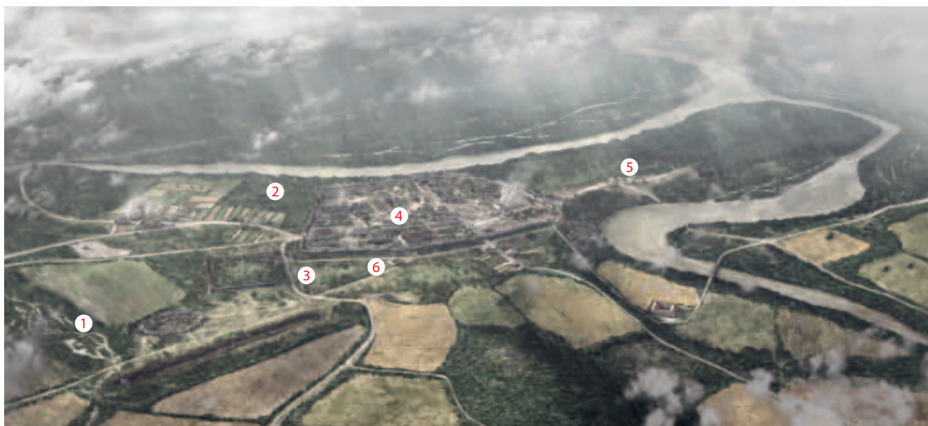
Abb. 3: Lebensbild zum nachlagerzeitlichen Vindonissa. Verkleinerte Darstellung der Planbeilage 3 mit Lokalisierung der im Text erwähnten Bereiche.

mittelbar westlich der principia gehörte (Abb. 2 Nr. 2). Ausserhalb des Legionslagers ist der Bereich unmittelbar nordwestlich der castra legionis gemäss den Ergebnissen einer Grossgrabung 20 (V.016.1) nunmehr ohne jegliche Steinbauten und daher als landwirtschaftlich genutztes Areal dargestellt (Abb. 2 Nr. 3). Direkt vor der Südwestfront des Legionslagers, an einer Strassengabelung der Zivilsiedlung ( canabae legionis ), sind gemäss Ausgrabungen der letzten Jahre (V.016.4; V.017.5; V.020.4) hingegen ein Steinbau und ein Töpferofen neu hinzugekommen 21 (Abb. 2 Nr. 4). Schliesslich zeigt das Lebensbild an der südöstlichen Peripherie der Zivilsiedlung, in der Reussniederung des heutigen «Fahrguet», einen grösseren Steinbau nahe einer ebenfalls neu rekonstruierten Strassenbrücke über die Reuss (Abb. 2 Nr. 5). Ausmass und Innengliederung des bislang nur über Bewuchsmerkmale und Luftbilder erfassten Komplexes wurden 2020 durch geophysikalische Messungen ergänzt (V.020.7), wobei einzuräumen ist, dass bislang kaum Funde vorliegen, die eine Erbauung noch im 1. Jh. n. Chr. belegen 22 .