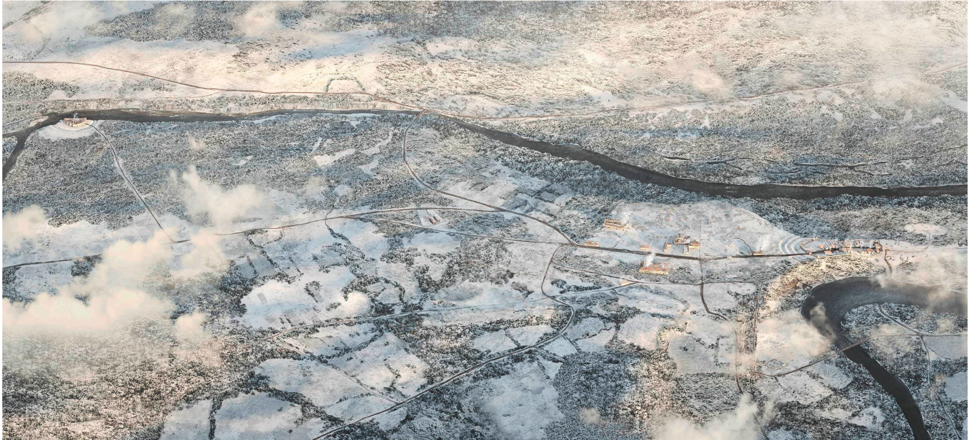
Beilage 4: Ein «Lebensbild» des römischen Vindonissa im späten 4. Jahrhundert n. Chr., Blick von Süden, Forschungsstand 2021 (Kantonsarchäologie Aargau/ikonaut GmbH, Brugg).